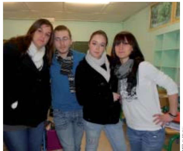
MFR de Morlaix