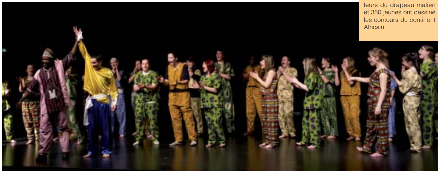
Conte et danse du Mali