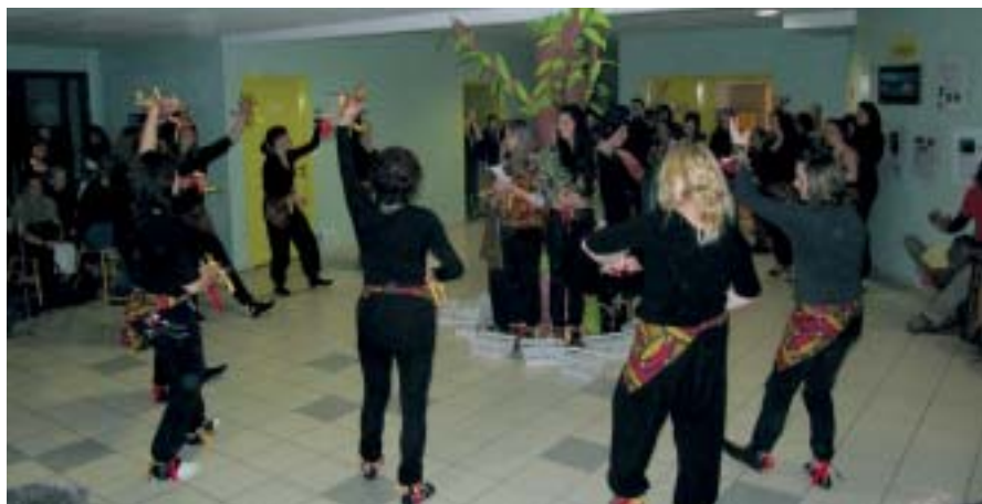
Danse africaine autour de l'arbre à palabres