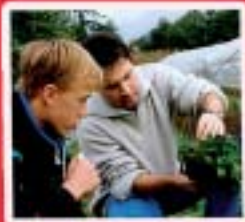
Horticulture, Paysage Fleuriste www.mfr-plabennec-ploudaniel.fr