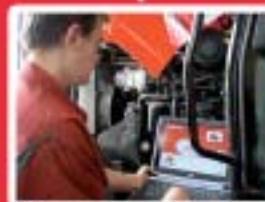
Mécanique, Agroéquipement www.mfr-elliant.com