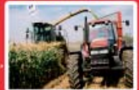
Agriculture Services aux Personnes www.mfr-pleyben.com