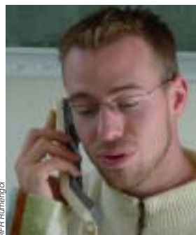
Briec contacte par téléphone les clients du Télégramme

de vente mais également aux conseils des professionnels du Télégramme . Ils connaissent bien leurs abonnés et ils nous ont formés à la connaissance du produit ainsi qu'aux arguments de vente spécifiques à ce produit. Au fur et à mesure que nous contactons nos interlocuteurs au téléphone, nous prenions de l'assurance et nous arrivions à les convaincre de l'intérêt de notre proposition. Le résultat attendu par Le Télégramme a été atteint et nous sommes fiers de notre travail. Nous espérons pouvoir mettre en pratique dans notre vie professionnelle future les compétences que nous avons acquises. Le phoning nous a en effet permis de mieux maîtriser professionnellement l'outil « té-