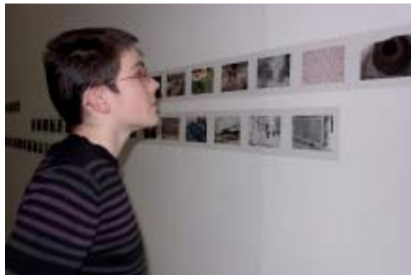
Observer et apprécier

Les élèves de troisième de la Maison familiale rurale de Ploudaniel se sont rendus au Centre d'Art Passerelle et au Musée des Beaux-Arts à Brest le jeudi 12 janvier. Ils ont apprécié l'exposition intitulée « Traces » qui évoque l'empreinte laissée par les corps comme étant témoins de leur absence. Par ailleurs, ils ont admiré les peintures du genre historique datant du XVIII e siècle, par exemple, La vue du port de Brest , peinte par Van Blarenberghen en 1774. Ils ont également plébiscité le portrait très réaliste, Pennavouez en Saint-Nic , peint en 1975 par