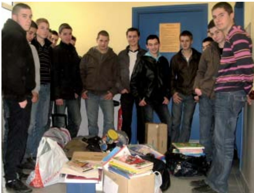
les 3 e à leur retour de collecte

Et les actions s'enchaînent pour récolter des fournitures scolaires : collecte pendant l'alternance et distribution de prospectus, journées de sensibilisation sur le Maroc avec préparation de pâtisseries marocaines et de thé à la menthe, création d'un blog, d'une adresse mail pour l'association. L'activité reprend en 3 e intégrant les nouveaux arrivants. IAM prend de l'ampleur, continue à récolter des fournitures, organise une vente de crêpes à l'Iréo. Journaux et radios locales