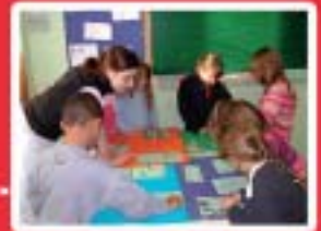
Services aux Personnes www.mfr-plounevez.com