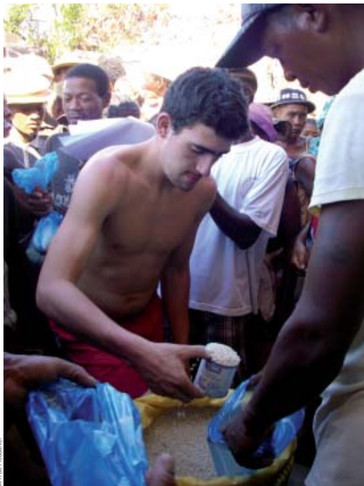
distribution du riz par les élèves à la suite du cyclone