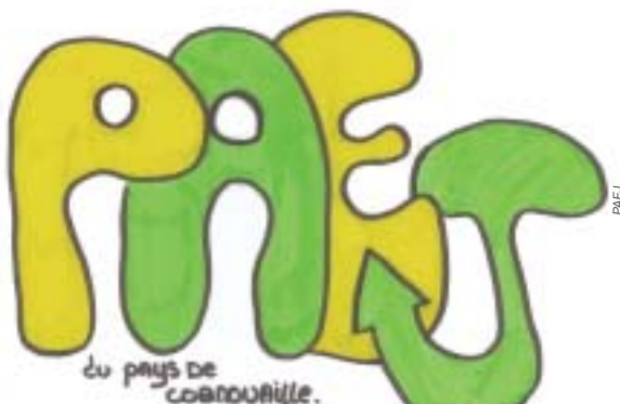
Création de Lionel Sifose - classe de 4 e