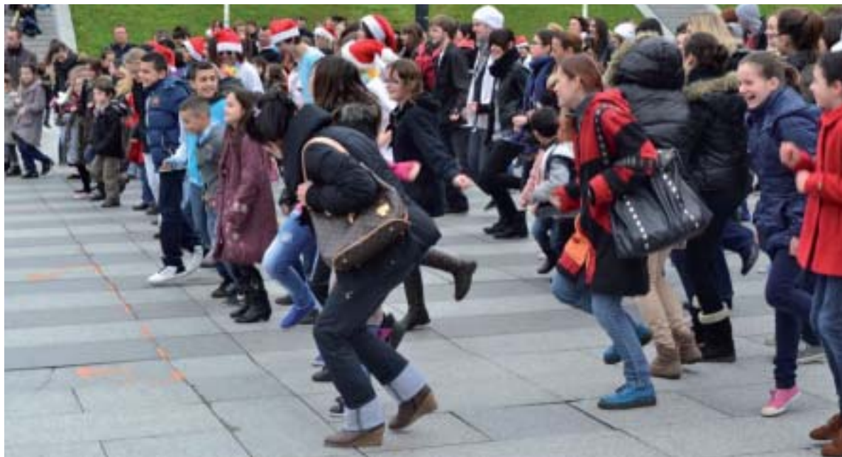
Flash Mob Place de la Liberté à Brest

Notre classe de BTS doit mener plusieurs actions de communication ainsi que des actions commerciales sur le territoire. Celles-ci peuvent être en lien avec des associations humanitaires comme France Alzheimer, une collecte de sang avec l'Établissement français du sang (EFS), la récolte de produits alimentaires pour le Secours populaire, un loto pour Leucémie espoir. Mais également dans l'animation comme l'organisation d'un flash-mob à Brest, un concours photos ou encore l'or-