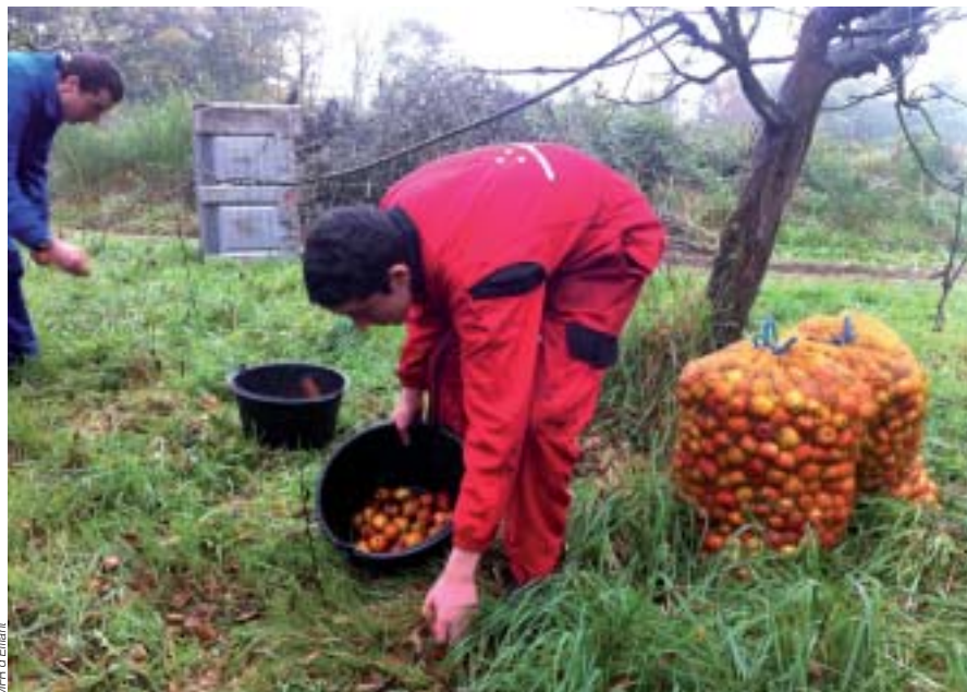
Ramassage des pommes par les élèves

Ils ont pu découvrir la technique de ramassage des pommes et se rendre compte à quel point cette tâche était fastidieuse. Équipés et dans la rosée du matin, les 35 élèves ont ramassé méthodiquement une bonne partie des pommes nécessaires à la production. La fin de matinée s'est terminée par le réconfort d'une dégustation de cidre et d'un goûter offert par les membres de l'association Elliant- kumandi koura.