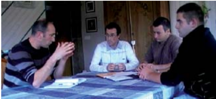
MFR de Morlaix