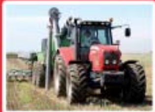
Agriculture, Horticulture Gestion Commerce www.irec.org