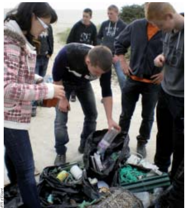
Résultat du nettoyage de la plage par les élèves de seconde

Cette sortie est aussi l'occasion d'observer la laisse de mer (bois flottés, crustacés, algues sèches) et de constater son utilité dans l'écosystème. Ainsi les élèves prennent soin de laisser sur le sable les éléments d'origine naturelle.