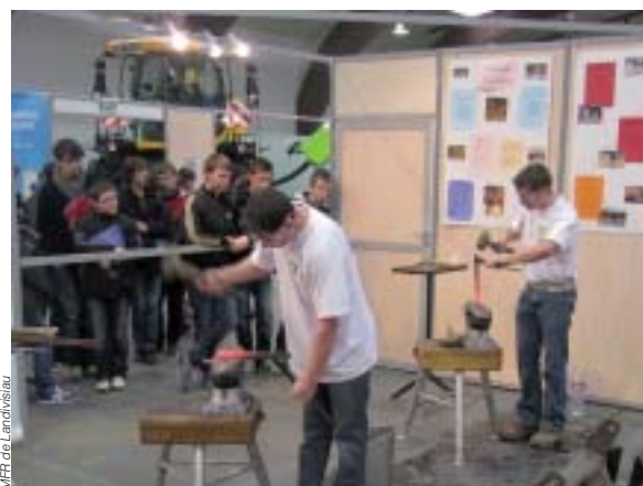
Les élèves en plein travail de forge

Organisées à Rennes les sélections régionales des Olympiades des métiers ont réuni pendant deux jours au parc des expositions, 280 jeunes Bretons de moins de 23 ans, concourant dans l'un des 40 métiers en compétition. Cette manifestation, pilotée par le Conseil régional, a accueilli près de 15000 visiteurs, dont 9000 scolaires, qui ont pu assister en temps réel à la réalisation des épreuves. La Maison familiale de Landivisiau était représentée par cinq de ces élèves en maréchalerie. Au terme de ces