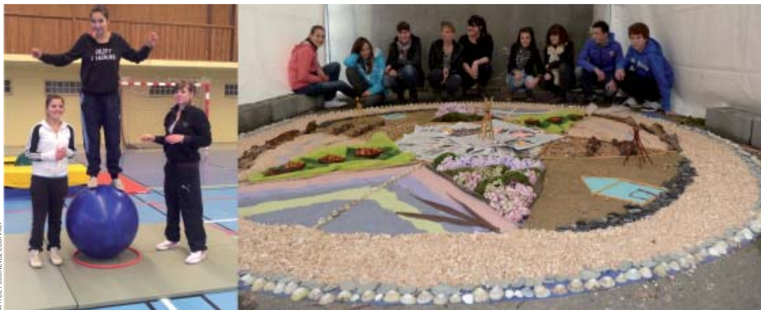
Expression corporelle et artistique des 4 e /3 e

C'est le cirque à la MFR! « On s'est initié à des ateliers de jonglage avec des balles, des anneaux, des foulards ou diabolos. En plus, on a testé des ateliers d'équilibre à l'aide d'une grosse boule, le Rola