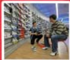
Vente, Commerce www.mfr-rumengol.com