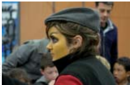
MFR de Morlaix

« Les éditions précédentes de la ferme pédagogique, c'étaient les formateurs de la Maison familiale qui étaient en contact avec les écoles primaires accueillies à l'occasion du festival de l'élevage de Morlaix. Cette année, nous avons été en charge de ce poste. En groupe, nous avons réfléchi aux différentes actions que nous pourrions mener. Nous avons décidé de créer un questionnaire pédagogique à envoyer auprès des écoles accueillies, avant le jour J. Nous avons également animé la journée 18 novembre, à Langolvas. Deux d'entre nous se sont déguisés en épouvantail et un autre en paysan. Ensuite, nous avons accueilli les enfants et les maîtresses à la sortie du car pour leur présenter le déroulement de l'après-midi. Chaque groupe d'enfants passait au stand photo où nous faisons une photo de classe. On a terminé par la distribution de muffins