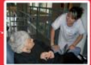
Agriculture Services aux Personnes www.mfr-moriaix.com