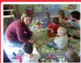
Services aux Personnes www.mfr-poullan.org