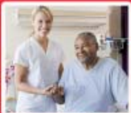
Services aux Personnes www.mfr-strenan.com