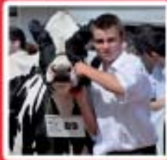
Agriculture Alimentation, Hygiène www.mfr-plabennec-ploudaniel.fr