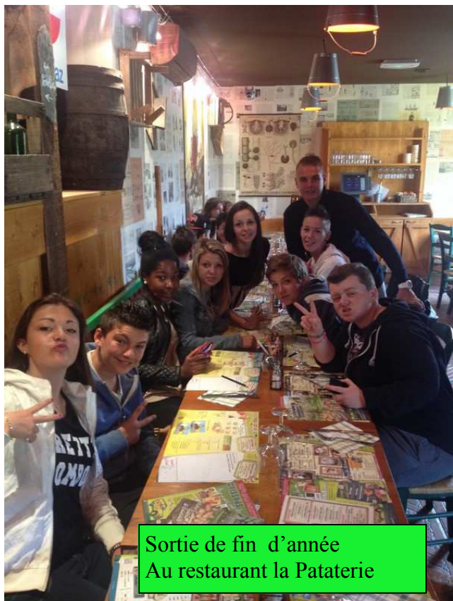
Sortie de fin d'année Au restaurant la Pataterie