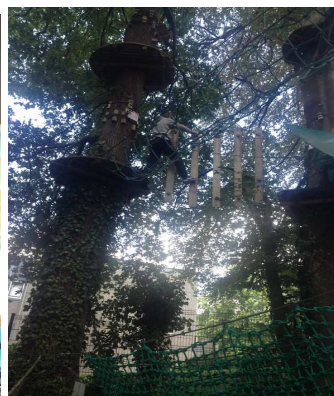
Activité acrobranche Mais qui est sur cette photo ?